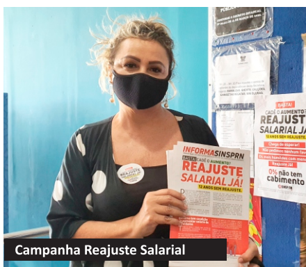
Campanha Reajuste Salarial