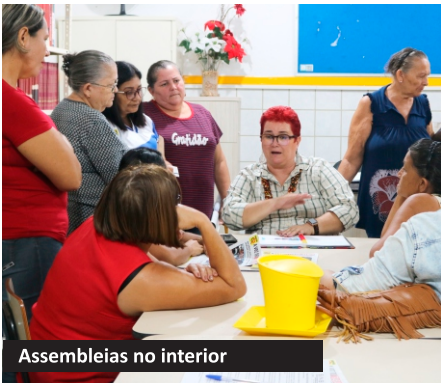
Assembleias no interior