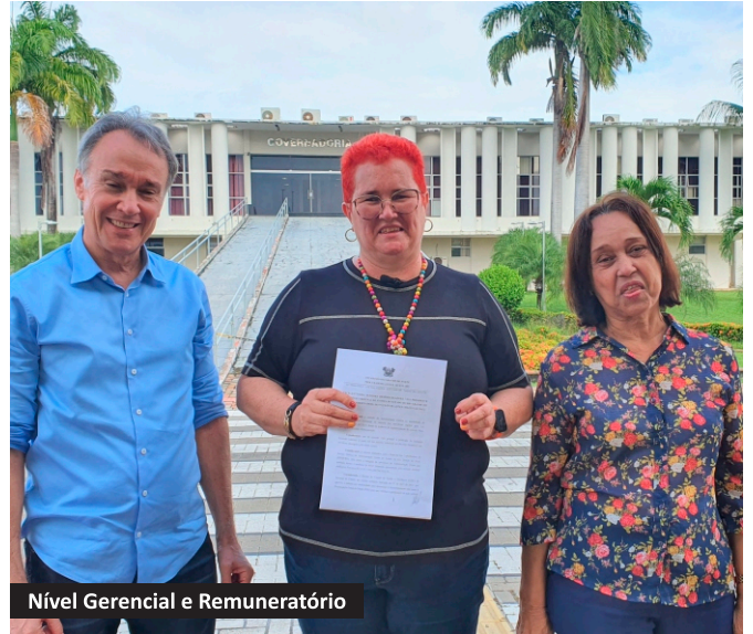
Nível Gerencial e Remuneratório