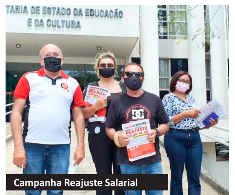
Campanha Reajuste Salarial