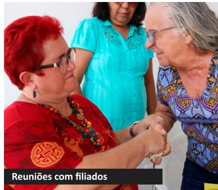
Reuniões com filiados