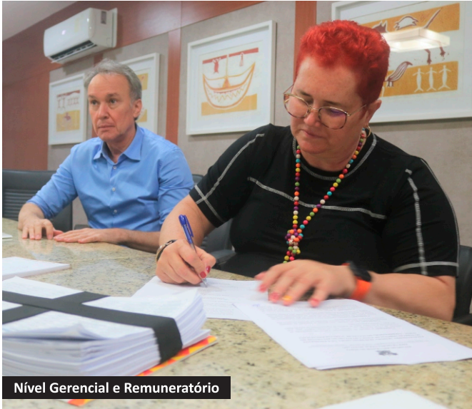
Nível Gerencial e Remuneratório